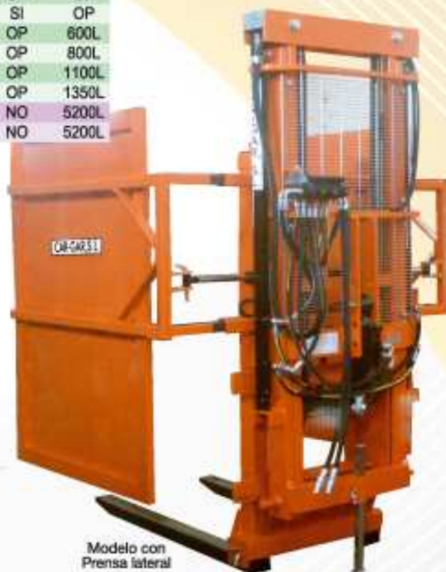
Modelo con Prensa lateral